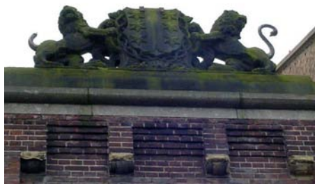
Detail boven entree 1910 voorgevel foto 2003