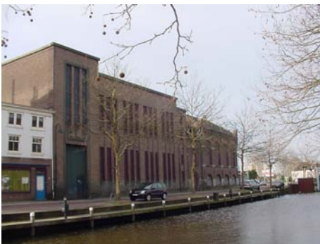
Gevel aan de Raam (april 2008)

De voormalige Goudsche Lichtfabriek is vanaf 1910 gebouwd op het terrein van het eertijdse Leprooshuis aan de Hoge Gouwe, aan de rand van de binnenstad. De lichtfabriek stond naast de gasfabriek, op dat moment ongeveer 25 jaar in bedrijf, waar de elektriciteitscentrale mee concurreerde. De centrale is diverse malen uitgebreid. Doordat onder meer de metaaldraadlamp op de markt kwam, zou vanaf 1910 het elektriciteitsverbruik sterk toenemen ten koste van het gasverbruik. De fabriek leverde niet uitsluitend stroom aan Gouda. Vanaf 1910 nam het aantal naburige gemeentes dat elektriciteit afnam gestaag toe. Eind jaren dertig werd de fabriek Gemeente Lichtfabrieken Gouda genoemd, afgekort tot GLF. In 1951 werd de naam gewijzigd in Gemeente Energie Bedrijf, afgekort tot GEB.