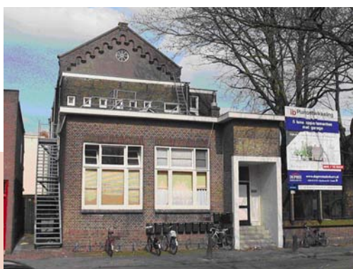
Gevel aan de Raam (april 2008)

Het gebouw is na 1907 door verschillende schoolverenigingen in gebruik geweest. In 1924 was het schoolgebouw in gebruik door de Christelijke Nationale School. Uit bewaard gebleven ontwerptekeningen blijkt dat deze school in dat jaar opdracht gaf tot een verbouwing waarbij de toiletgroepen werden gemoderniseerd, de binnenplaats met entree tussen schoolgebouw en Hoge Gouwe werd veranderd, en een 'onderwijzerslokaal' werd toegevoegd. In 1928 vroeg de Vereniging voor Christelijk Nationaal Schoolonderwijs Da Costaschool een bouwvergunning aan voor een verbouwing waarbij op de begane grond aan de zijde van de Raam een leslokaal werd bijgebouwd, op de plek van de speelplaats. In de jaren vijftig is het gebouw onder andere in gebruik door de Gouweschool en de openbare school voor v.g.l.o (voortgezet gewoon lager onderwijs) een 'centrale kopschool'. In 1981 was het gebouw in gebruik door de LEAO, Lager economisch en administratief onderwijs. De huidige entree in de portiek aan de Raam die gebruikt wordt door de huidige bewoners van het voormalige schoolgebouw is waarschijnlijk pas na 1981 gebouwd.