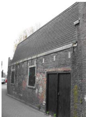
Houtenstraat 19, rechter deel van de gevel aan de Vest (foto april 2008)