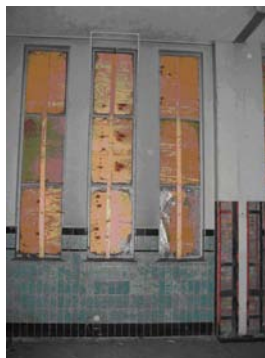
Interieur schakelruimte deel 1939 (foto uit 2007)

Het centrale gebouw uit 1910 is ontworpen door gemeentebouwmeester L. Koole en heeft stijkenmerken van de art-nouveau. Achter dit centrale gebouw stond een Ketelhuis, ook in 1910 gebouwd, dat op de begane grond over de gehele lengte van de gevel verbonden was met de voorbouw. Op de begane grond van het ketelhuis waren twee stoomketels opgesteld, die de turbines in de voorbouw aandreven. Deze achterbouw is omstreeks 1959 grotendeels gesloopt. Tussen 1937 en 1939 is de centrale aan de zuidoostzijde uitgebreid met een schakelhuis, ontworpen door de afdeling Elektriciteit van de Gemeente Lichtfabrieken Gouda. Het onderscheid tussen het centrale gebouw en schakelstation komt in het exterieur onder meer tot uitdrukking in de gevelindeling en het kenmerkende materiaalgebruik dat bij het hoofdgebouw relatief afwisselender is.