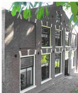
Voorgevel van het voorhuis (foto april 2008)

De diverse onderdelen van dit historische gebouwencomplex met de terreinaanleg en de ligging langs de dijk geven een goed beeld van de agrarische bedrijfsvoering op de boerderij, die in 2008 in gebruik is met een agrarische functie. In 2008 wordt de boerderij gebruikt voor onder meer zoogvee (twaalf tot twintig koeien en kalveren), ongeveer tien tot twintig schapen en lammeren en een geit. In deze beschrijving worden de waardevolle hoofdelementen van dit omvangrijke ensemble beschreven.