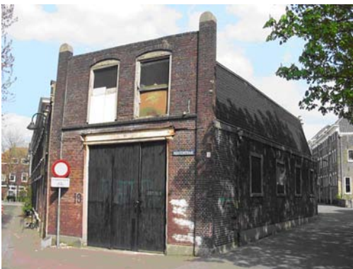
Houtenstraat 19 (foto april 2008)

Het bedrijf Goedewaagen heeft een lange historie in Gouda. In 1779 wordt Dirk Goedewaagen als meesterpijpenmaker opgenomen in het pijpenmakersgilde. Aanvankelijk worden in een werkplaats aan de Keizerstraat kleipijpen geproduceerd, maar na verloop van tijd wordt het bedrijf verplaatst naar een terrein tussen Gouwe en de Raam (onder meer Hoge Gouwe 97, 99, 101 en de Raam 55, 57). Om over een eigen oven te beschikken, en om de productie uit te breiden met aardewerk, wordt in 1853 De Star opgekocht, op een andere locatie aan de Raam.