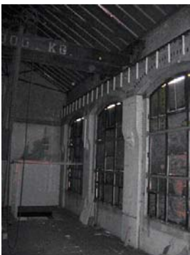
Interieur Turbinezaal centrale deel uit 1910 (foto uit 2007)