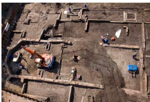
Opgravingen op het Bolwerk

In de periodieke ontmoeting van de stadsarcheoloog met de commissie over de stand van zaken over de archeologie in Gouda is een korte uiteenzetting gegeven over onder meer een onderzoek op de bouwlocatie Bolwerk. De definitieve resultaten van de verrichte onderzoeken worden in 2010 in een conceptrapport weergegeven. Er zijn veel kleine onderzoekjes uitgevoerd mede door de beschikbare budgetten, die een helder beeld geven van de geschiedenis van het gebied. Al deze deelonderzoekjes moeten nog gecombineerd worden tot één verhaal.